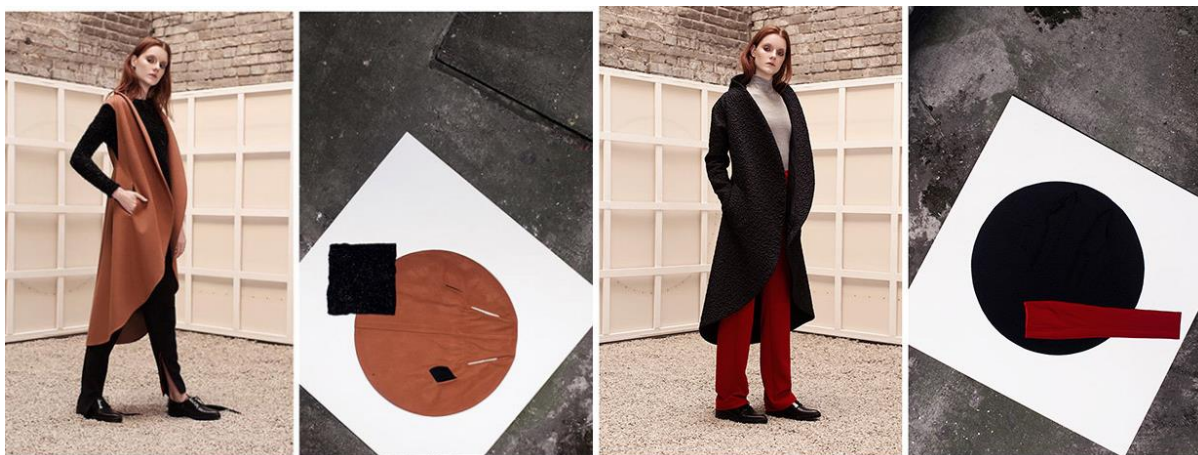
Рис. 4. Елементи колекції «Супрематизм 2.0», Ф. Возіанов, 2016 р.

Висновки. Було проведено аналіз використання основних елементів супрематизму у сучасному дизайні, наведено приклади дизайну інтер'єру та дизайну одягу. Супрематизм знайшов своє втілення в сучасному дизайні, став чудовим джерелом натхнення для створення нових дизайнерських виробів. Враховуючи його переваги, варто зазначити, що цей стиль актуальний у наш час, так як не потребує значних психологічних та матеріальних витрат, тому що має мінімальне смислове навантаження. Речі, оформлені у супрематичному стилі, надають відчуття комфорту, сприяють релаксації. Своєю оригінальністю та нестандартним підходом до зображення дійсності супрематизм може задовольнити смаки сучасного споживача.