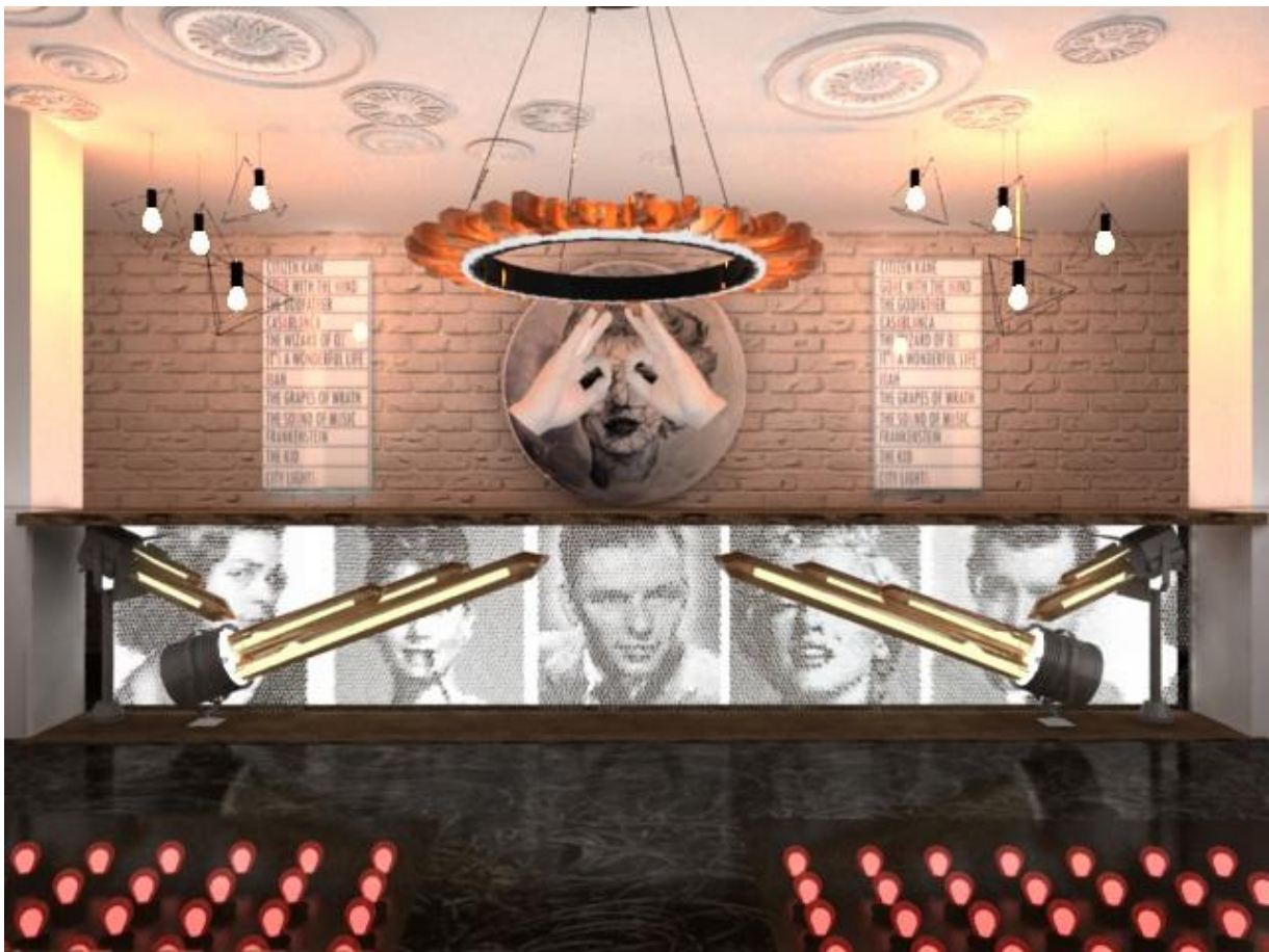
Рис.1 Візуалізація проекту інтер'єру вестибюля кінотеатру з касами

увагу до смуги прокрутки зображення фотографій відомих кіноакторів, включається по сенсорному сигналу появи глядачів в коридорі біля кас. Руки в печатках на тондо привертають увагу своєю спрямованістю у вигляді бінокля до глядача. Кола на стелі обираються до класичної спадщини, в тому числі в кіно. Тондо на стіні і ліпнина на стелі композиційно об'єднані круговим світильником, що складається ніби з язиків полум'я.