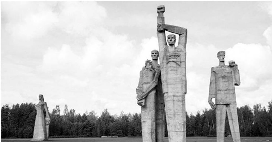
Рис. 2. Скульптурні групи меморіального комплексу «Саласпілс». Латвія. Ілюстративний матеріал [9]

На зеленому газоні розміщені чотири скульптурні композиції, які символізують неймовірні людські страждання, боротьбу та мужність. Зображення людських постатей навмисно узагальнено-стилізовані, бруталними та спрощеними силуетами, фактурою та деталями виражено та посилено не тільки контраст об'ємів у просторі ансамбля, кожна скульптура являє собою самодостатню композицію, але «спілкуються» одна з іншою у межах сюжетної лінії комплексу. Кожна з цих скульптурних композицій символізує відповідний образ та має свою назву – «Принижена», «Незламний», «Мати», та скульптурна група – «Солідарність», «Клятва», «Рот фронт». Також, завдяки узагальненому і спрощеному силуету вони виглядають навіть з великої відстані, як символ і образ-знак у відкритому просторі комплексу та набувають певної інформативності, пізнаваності (рис.2).