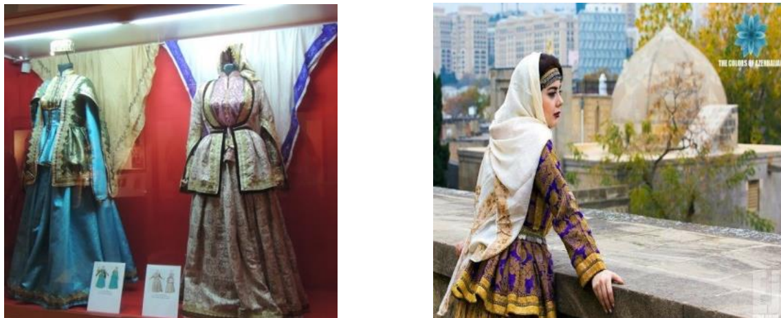
Рис.1. Платок келагаи

почти вышли из быта азербайджанцев и стали историей. Одна из важнейших задач, стоящих перед исследователями, это передача следующему поколению богатой традиции, производства шелковых келагаи.