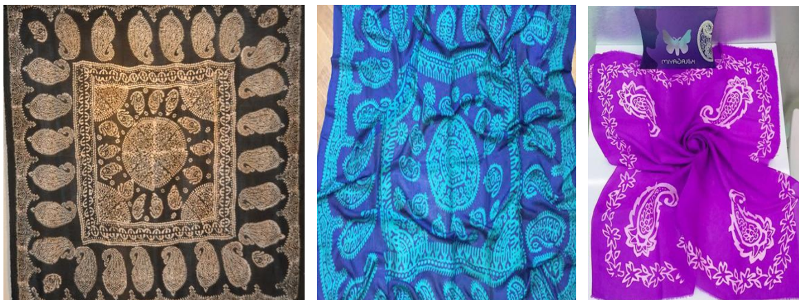
Рис.2. Образцы платков келагаи

Производство тонких и нежных келагаи - длительный, тяжелый рабочий процесс, требующий огромного терпения. Плетение келагаи, как и шелкового джеджима (ковра), велось вручную и считалось древнейшим ремеслом. Этим занимались только женщины. Рельефными рисунками украшали края и середину келагаи. Орнаменты разных производителей отличались друг от друга. Популярными орнаментами считались «солнце», «шейх», «шаш», «бута», «бадам», «клубника» и «полумесяц». Образцы платков келагаи приведены ниже (рис. 2).