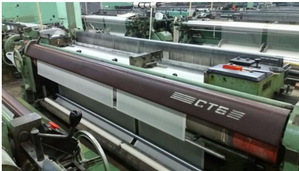
Рис. 4. Формирование келагаи на ткацком станке